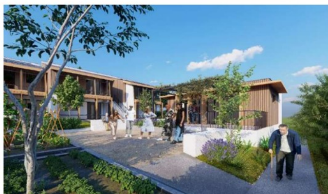
Vue de la placette