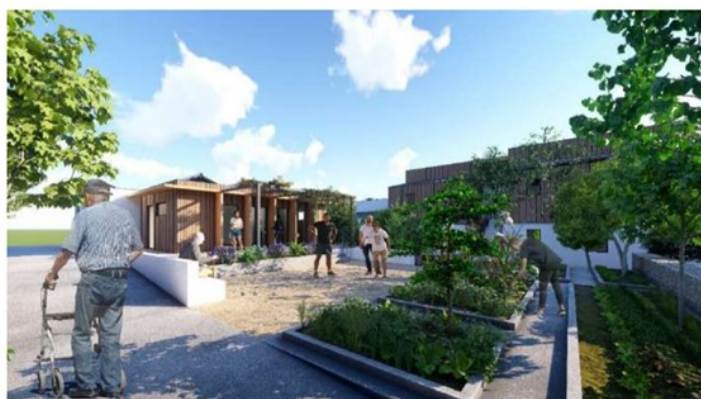
Vue du potager et salle commune